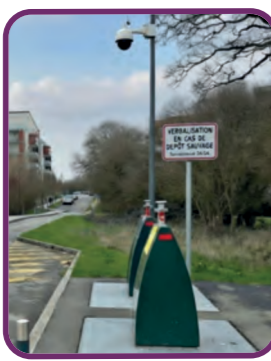
Verbaliser les dépôts sauvages et les incivilités

Vous avez noté un manque d'entretien. Nous nous engageons à :