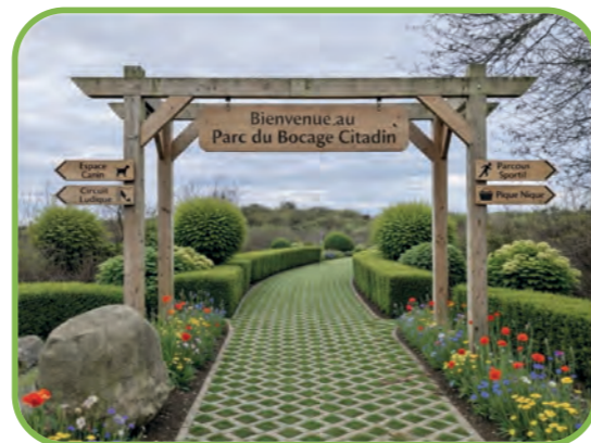
Exemple d'aménagement possible en entrée du futur Parc du Bocage Citadin