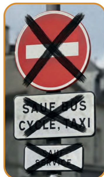
Dans l'attente du nouveau Plan Communal de Déplacement, nous rétablirons le double sens de circulation avenue André Bonnin.