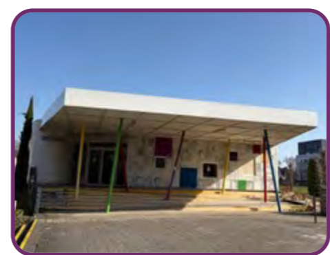
le Pôle Petite Enfance