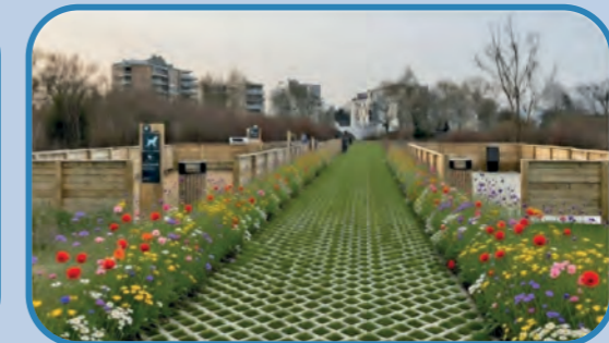
Exemple d'aménagement possible pour un espace canin sécurisé au Parc du Bocage Citadin