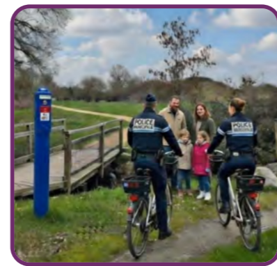
Mise en place de bornes d'appel d'urgence