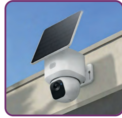
Extension et modernisation du réseau de caméras de vidéoprotection.